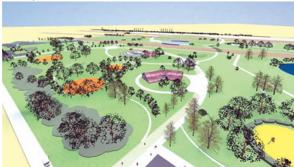
Parcul Ploiești Vest