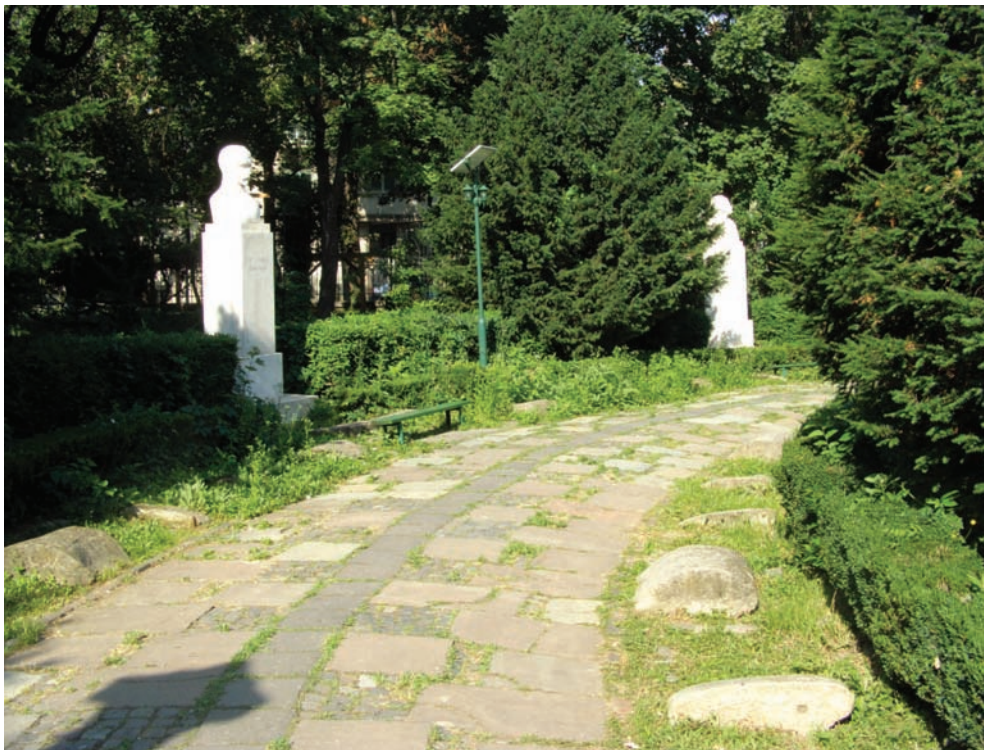
Rotonda Scriitorilor, Parcul Cișmigiu