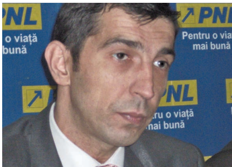
Ciprian Dobre, președintele CJ Mureș

Aproape 111 milioane de euro vor fi investiți până în 2015 în infrastructura de apă și apă uzată