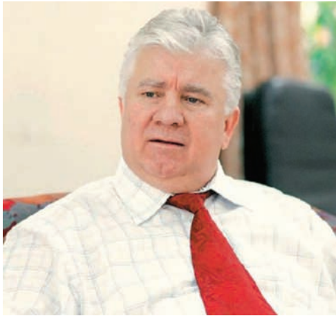
Culiță Tărăță, noul președinte al Consiliului Județean Neamț

Finanțarea este asigurată din fonduri rambursabile acordate de Banca Internațională pentru Reconstrucție și Dezvoltare (BIRD), fonduri nerambursabile acordate de Facilitatea Globală de Mediu (GEF) și fonduri locale de la Consiliile Județene și Consiliile Locale. Lucrările erau în faza de licitare, la jumătatea lunii august.