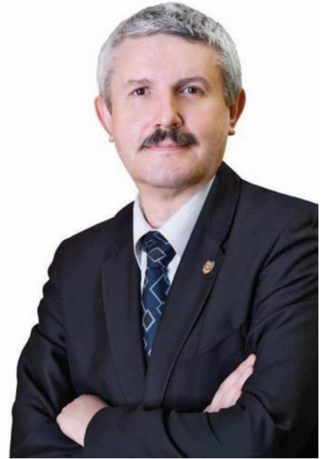
Emilian Frâncu, primarul municipiului Râmnicu Vâlcea

Primăria mai intenționează să amenajeze un bazin de înot în zona Chimistului, pe amplasamentul fostului ștrand și să realizeze o sală de sport la Grupul Școlar Sanitar „Antim Ivireanu”. Pentru ambele obiective au fost inițiate demersuri la CNI.