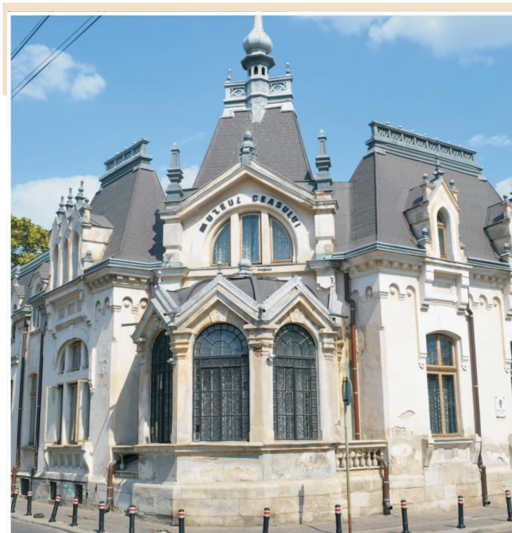
CJ Prahova va mai restaura și consolida Muzeul Ceasului Nicolae Simache din Ploiești.

Consiliul Județean Prahova a asigurat includerea acestor fișe în portofoliul județean și regional de proiecte pentru infrastructură și susțin finanțarea lor cu fonduri europene prin programele