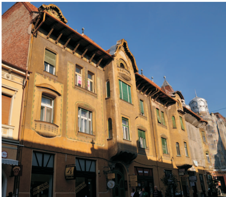
Investiția pentru restaurarea fațadei Palatului Stern este de 766.313 lei (fără TVA), durata de realizare a investiției fiind de 18 luni.

Viceprimarul Mircea Mălan a declarat: "Proiectul tehnic revizuit impune modificarea indicatorilor tehnico-economici aferenți implementării proiectului și crește eficiența de funcționare a complexului în ansamblu. Obiectivul general al proiectului este crearea unui aquapark modern, la standarde europene, prin crearea complexului urmărindu-se diver-