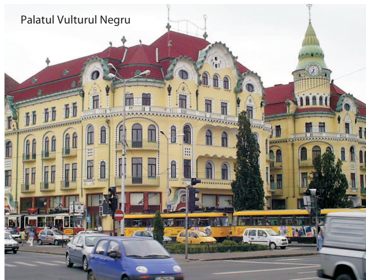
Palatul Vulturul Negru

Potrivit oficialului primăriei, termenul de finalizare al lucrărilor este de 30 de luni de la 31 ianuarie 2014, iar valoarea estimată a investiției este de 65.724.913 lei fără TVA.