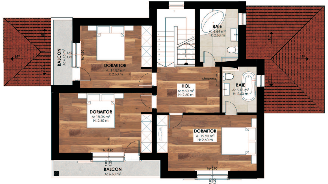
PLAN ETAJ S construita - 123.00mp

Tâmplăria interioară este din stejar masiv, stratificat. Acoperișul clădirii este tip șarpantă în 9 ape. Finisajele interioare prevăzute sunt moderne și de calitate. Pentru pereți și tavane s-au ales zugrăveli lavabile anticondens și zugrăveli pe baza de cuarț.