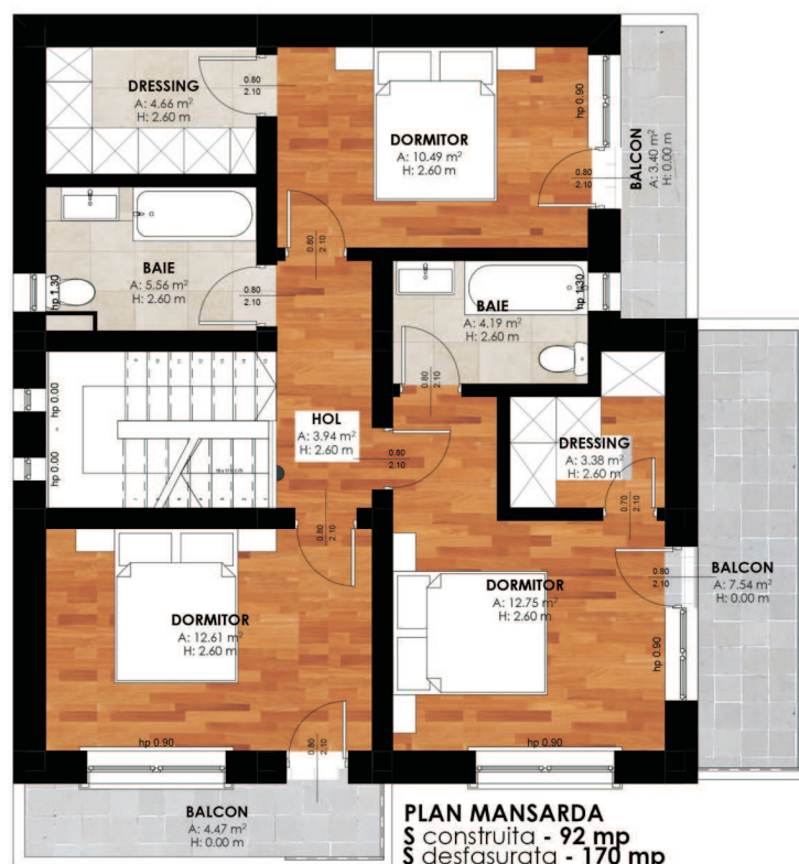
PLAN MANSARDĂ § construită - 92 mp § desfășurată - 170 mp