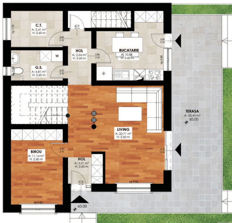
PLAN PARTER § construită - 92 mp § desfășurată - 170 mp

Tâmplăria interioară este din stejar masiv, stratificat. Acoperișul clădirii este tip șarpantă în 3 ape. Finisajele interioare prevăzute sunt moderne și de calitate. Pentru pereți și tavane s-au ales zugrăveli lavabile anticondens și zugrăveli pe baza de cuarț.