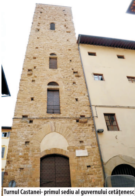
Turnul Castanei- primul sediu al guvernului cetățenesc