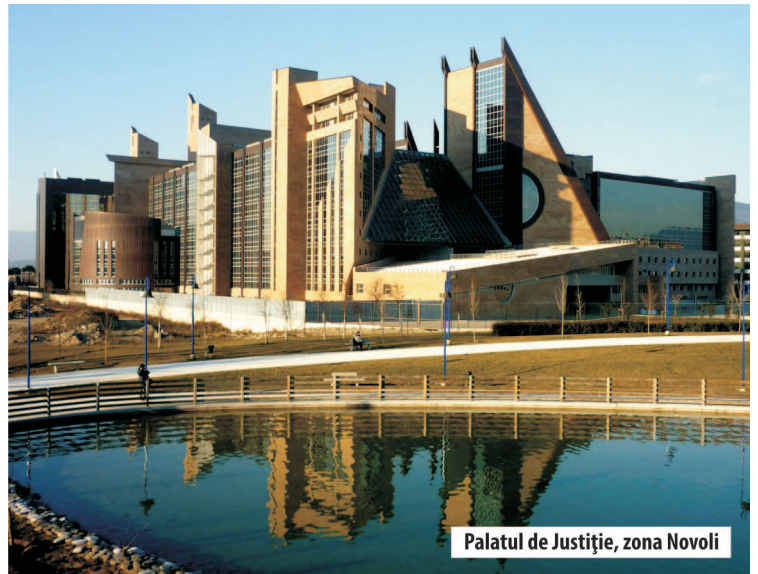
Palatul de Justiție, zona Novoli

Palazzo Strozzi, construit la sfârșitul secolului al XV-lea, a rămas în proprietatea familiei până în anul 1937, când a fost cedat statului. Este unul dintre cele mai importante exemple de palate renaștentiste din Italia, sediu al Fundației Palazzo Strozzi, o structură public-privată, condusă de un Consiliu de Administrație indepen-