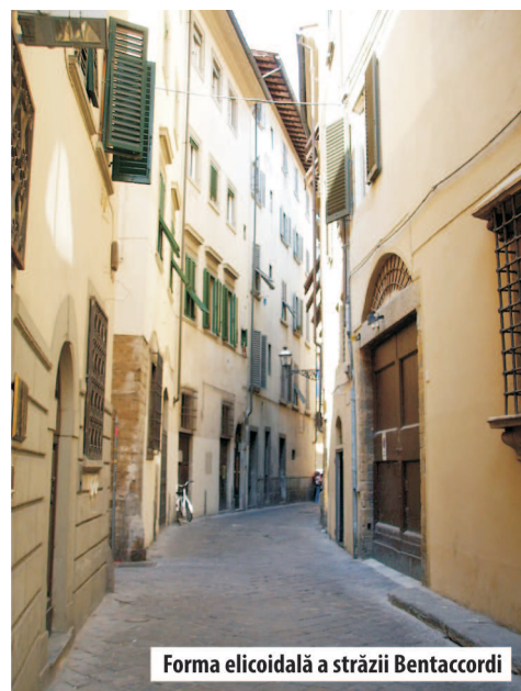
Forma elicoidală a străzii Bentaccordi

În anul 1327, orașul număra 96.000 de locuitori, dintre care 90% știau să scrie și să citească. La acea vreme, orașul avea în jur de 150 de case-turn, care, uneori, ajungeau la o înălțime de 60 metri. Existau adevărate străzi suspendate, ce constau în punți de legătură poziționate la diferite etaje ale caselor și care permiteau trecerea de