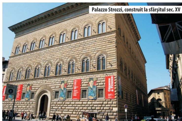
Palazzo Strozzi, construit la sfârșitul sec. XV