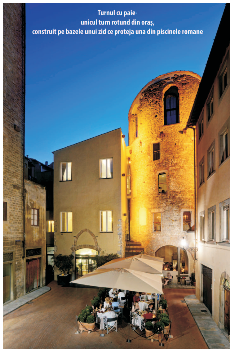
Turnul cu paie- unicul turn rotund din oraș, construit pe bazele unui zid ce proteja una din piscinele romane

mai mari artiști, de-a lungul secolelor: Giotto, Masaccio, Brunelleschi, Michelangelo, Leonardo da Vinci, Botticelli, Galileo Galilei. Se spune că dacă o singură operă ar lipsi din acest oraș, istoria timpuri-