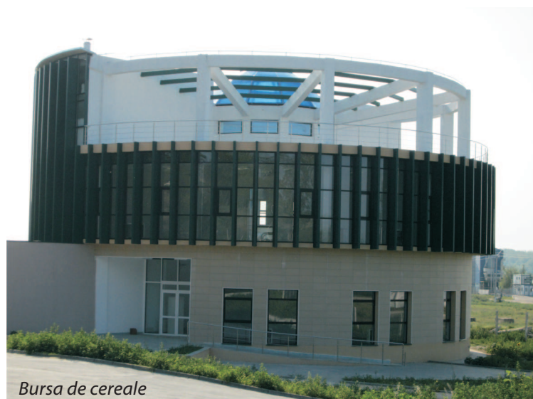
Bursa de cereale

De asemenea, instituția a realizat un parteneriat cu Consiliul Local Corabia în vederea atragerii de fonduri europene pentru proiectul "Port Turistic și de Agreement în zona Cap Amonte - Port Corabia", proiect finanțat în cadrul Programului Operațional Regional, Axa 5, Domeniul de intervenție „Crearea, dezvoltarea, modernizarea infrastructurii de turism pentru valorificarea resurselor naturale și creșterea calității serviciilor turistice”, cu o valoare de 15,3 milioane de lei, urmând ca jumătate din costuri să fie suportate de CJ Olt.