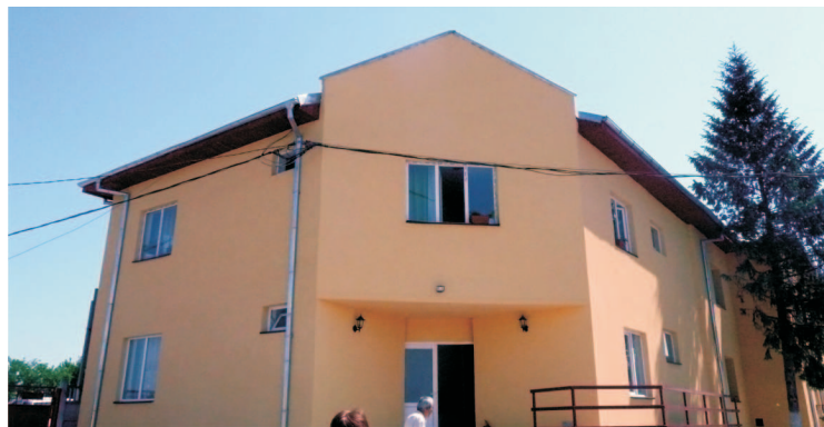
Centrul de Îngrijire și Asistență Șopirlița

Proiectul prevede, printre altele, achiziția a 6445 de containere pentru colectarea selectivă (hârtie, carton, plastic, sticlă, deșeuri amestecate) și achiziția a opt tocătoare