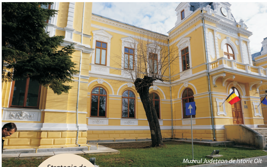
Muzeul Județean de Istorie Olt

Oficialii CJ Olt ne-au declarat: "Strategia de dezvoltare a județului Olt propune o nouă abordare pentru perioada 2014-2020, prin oferirea unei perspective realiste asupra problemelor și oportunităților cu care se confruntă județul și a modului în care acesta se poate redefini și pune în valoare la nivel regional și național. Politicile publice care se elaborează pe această bază, precum actuala Strategie Națională pentru Dezvoltare Durabilă a României (care acoperă orizontul de timp 2015-2020-2030), urmăresc restabilirea și menținerea unui echilibru rațional, pe termen lung, între dezvoltarea economică și integritatea mediului natural în forme înțelese și acceptate de societate. Cadrul strategic de dezvoltare pentru următorii 10 ani este definit de Strategia Euro-