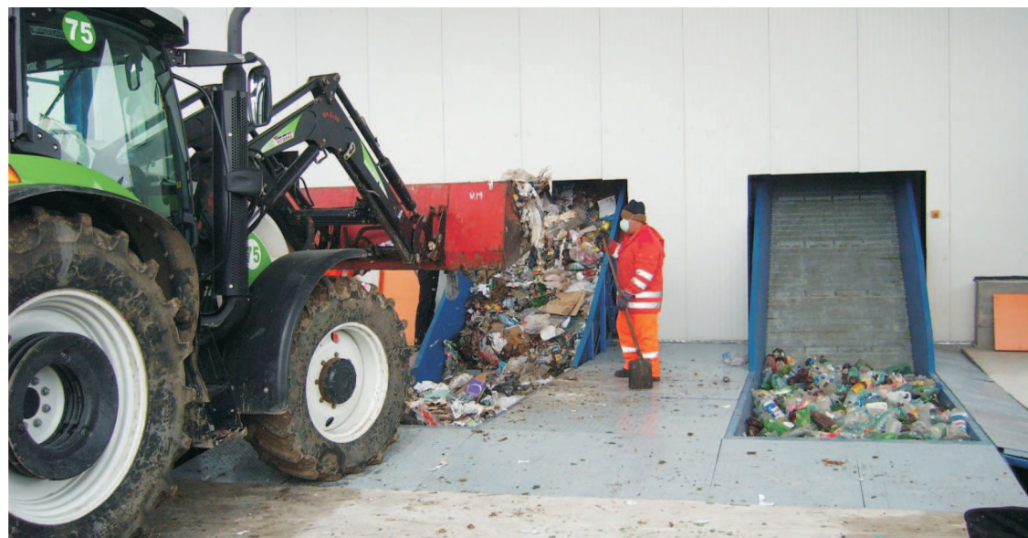
"Proiectul urmărește să implementeze un sistem de management integrat al deșeurilor municipale în județul Suceava, care să asigure un grad de colectare a deșeurilor de 100% în mediul urban".

✓ contravaloarea pierderii de creștere, determinate de exploatarea