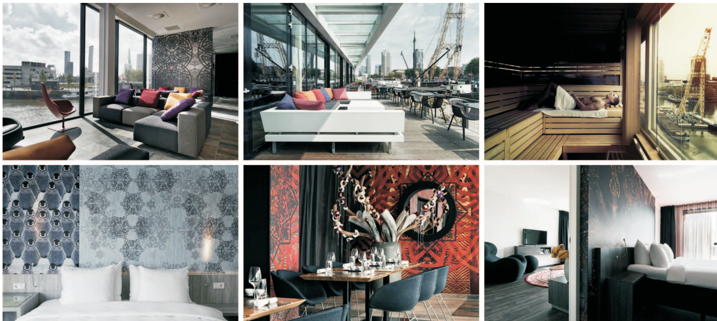
Mainport Hotel Rotterdam Curio Collection by Hilton.